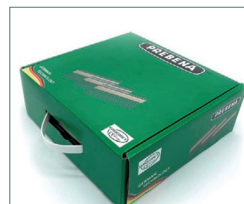
Lieferung in Schachtel